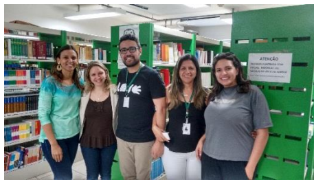
Campus Taguatinga Centro. Em: 03/06/2016

As Bibliotecas do campus Planaltina e do campus Taguatinga Centro foram as primeiras a serem visitadas. O cronograma de visitas prevê que todas as bibliotecas recebam esta visita de diagnóstico até meados de agosto.