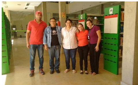
Campus Planaltina. Em: 20/05/2016

Esta ação visa embasar a elaboração do Plano de Desenvolvimento das Bibliotecas, além de garantir uma melhor visualização da situação das atividades desempenhadas por essas. Diagnósticos dessa natureza favorecem a tomada de decisão que, por sua vez, torna mais eficiente e racional a aplicação dos recursos.