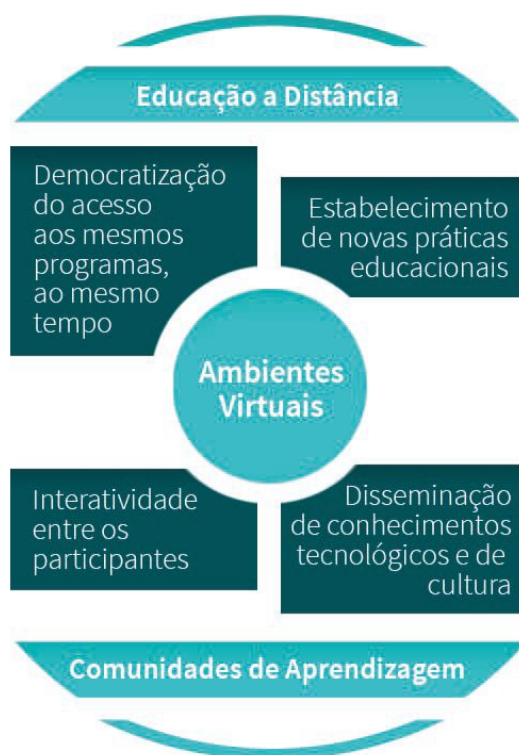
Figura 01: Apresentação da dinâmica dos AV.

Nota-se que há um potencial no processo de ensino e aprendizagem e que as didáticas utilizadas, suas metodologias, recursos e atividades potencializam a aprendizagem, pois neste universo da EAD, existe uma estrutura organizacional com objetivos de produzir e levar o conhecimento intelectual para toda uma comunidade ativa e participante, para os seus alunos, professores e administradores. Abaixo segue figura 01, que faz um entendimento desse processo.